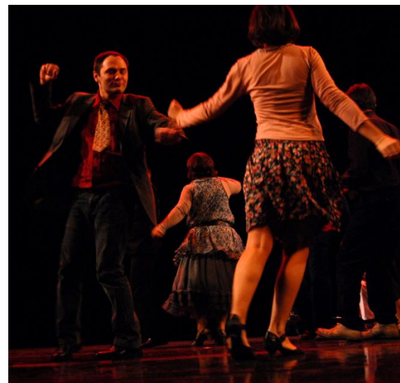
La Diva du Dancing, Cie Cantal, CDMDT15

Danses croisées, convivialité et paysage